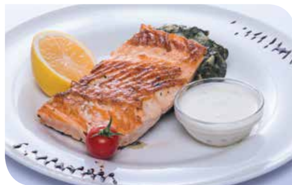
File lososa sa limun sosom Salmon fillet with lemon sauce Филе лосося с лимонным соусом