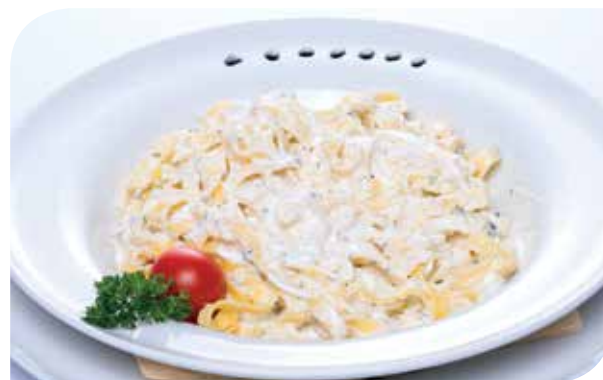
Taljatele sa 4 vrste sira Tagliatelle with 4 cheese sauce Тальятелле с 4 видами сыра