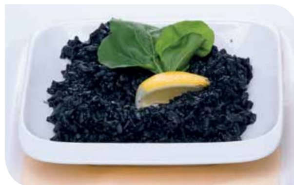
Crni rižoto Black risotto Черное ризотто