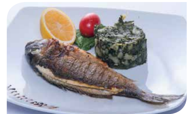
Brancin / Orada Sea Bass / Sea Bream Морской волки / Орада