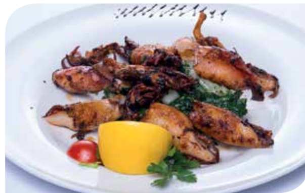
Lignje na žaru Grilled squid Кальмары на гриле