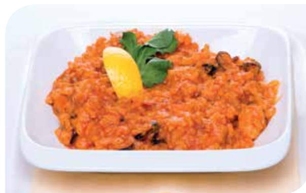
Crveni rižoto Red risotto Красный ризотто