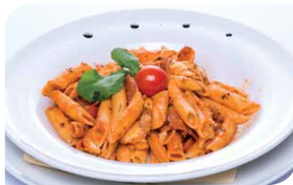
Pašta Montenegro ( pršut, njeгуški sir, paradajz ) Pasta "Montenegro" ( prosciutto, Njegusi cheese, tomato ) Паста "Монтенегро" ( приут, негушки сыр, помидоры )

PASTAS, RISOTTOS AND GNOCCHI / ПАСТА, РИЗОТТО И НЬОКИ