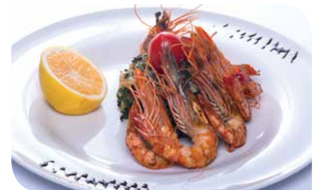
Gambori Gamberi shrimps Креветки