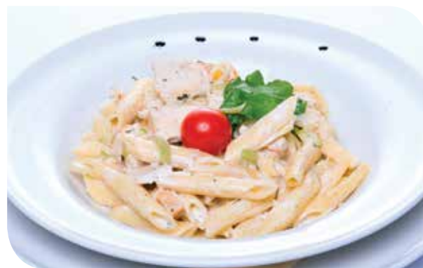
Pašta sa piletinom i tikvicama Pasta with chicken and zucchini Паста с цыплатиной и кабачками