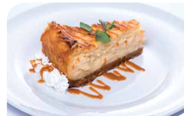
New York cheese cake