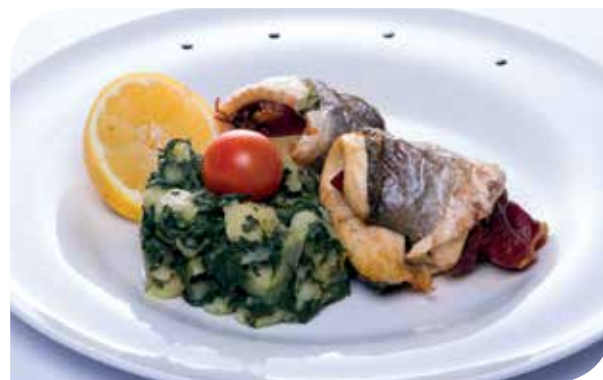
File brancina/orada rolovan u povrću Sea bass fillet rolled in vegetables Филе морского окуня/лещ прокат в овощах