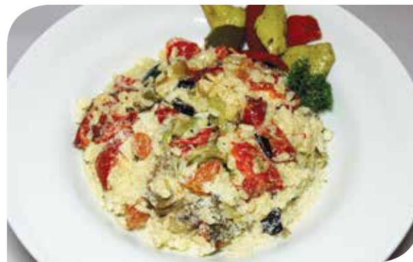
Rižoto sa povrćem Risotto with vegetables Ризотто с овощами

PASTAS, RISOTTOS AND GNOCCHI / ПАСТА, РИЗОТТО И НЬОКИ