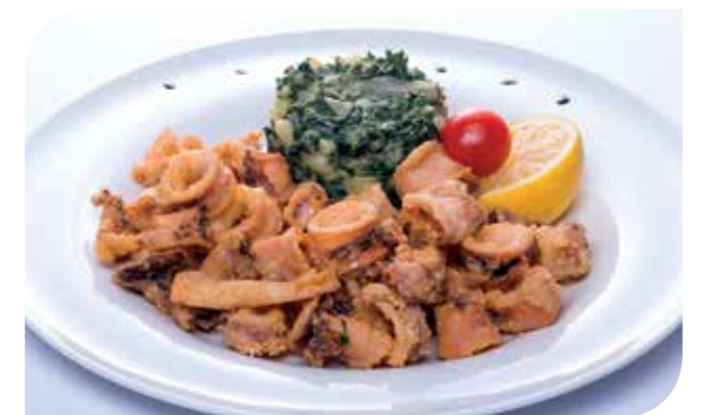
Pržene lignje Fried calamari Жареные кальмары