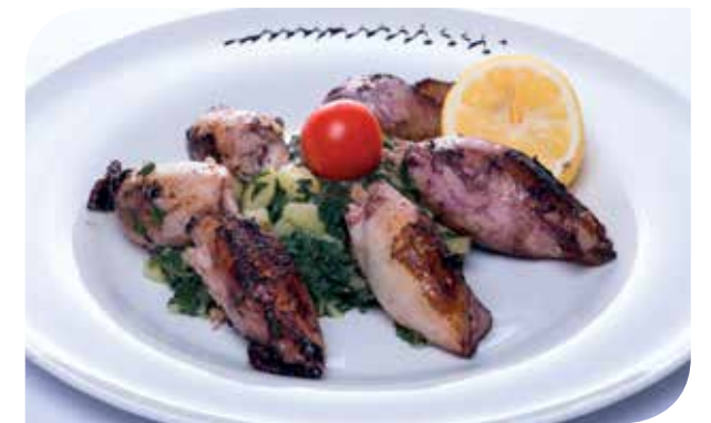
Ražnjići sa plodovima mora Skewers with seafood Шашлык с морепродуктами