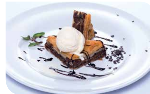
Kolač od urne